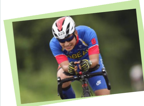
スペインのトライアスロン世界選手権大会や、全日本トライアスロン皆生大会に出場。