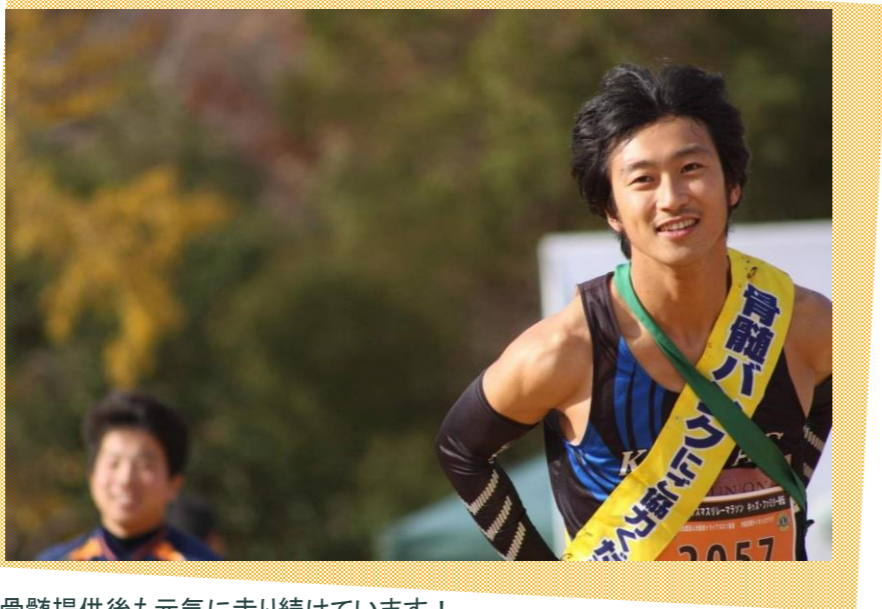
骨髄提供後も元気に走り続けています！ 全国各地のマラソン大会に、骨髄バンクランナーとして出場中！！ 出場する度に、今も走れていることに感謝、感動し、涙が溢れます。